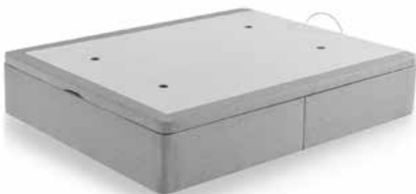
CNP IRON 30 PART. + TAP 3D