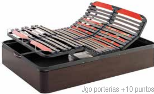
Jgo porterías +10 puntos