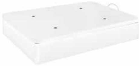
CNP AGORA 35 T/3D