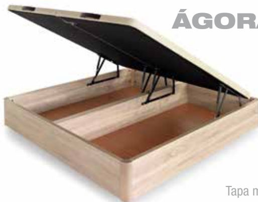
Tapa mixta +36 puntos