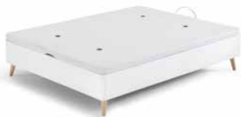
CNP ATH-20 C/ TAPA 40X30 TAP.