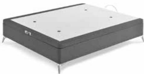
CNP IRON 20 ENTERO SIN PATAS + TAPA 30X30