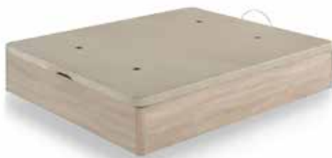
CNP ANDROS 22 T/3D