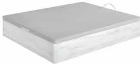
CNP ATHENAS 30 T/3D