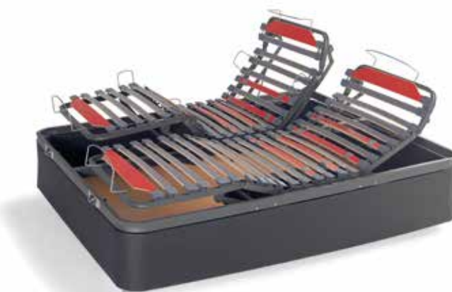
Jgo porterías +10 puntos

CNP. IRON 30 ENT. + CAMA A MOTOR 1 CUERPO