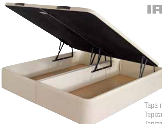
Tapa mixta +36 puntos Tapizado S2 +70 puntos Tapizado S3 +90 puntos